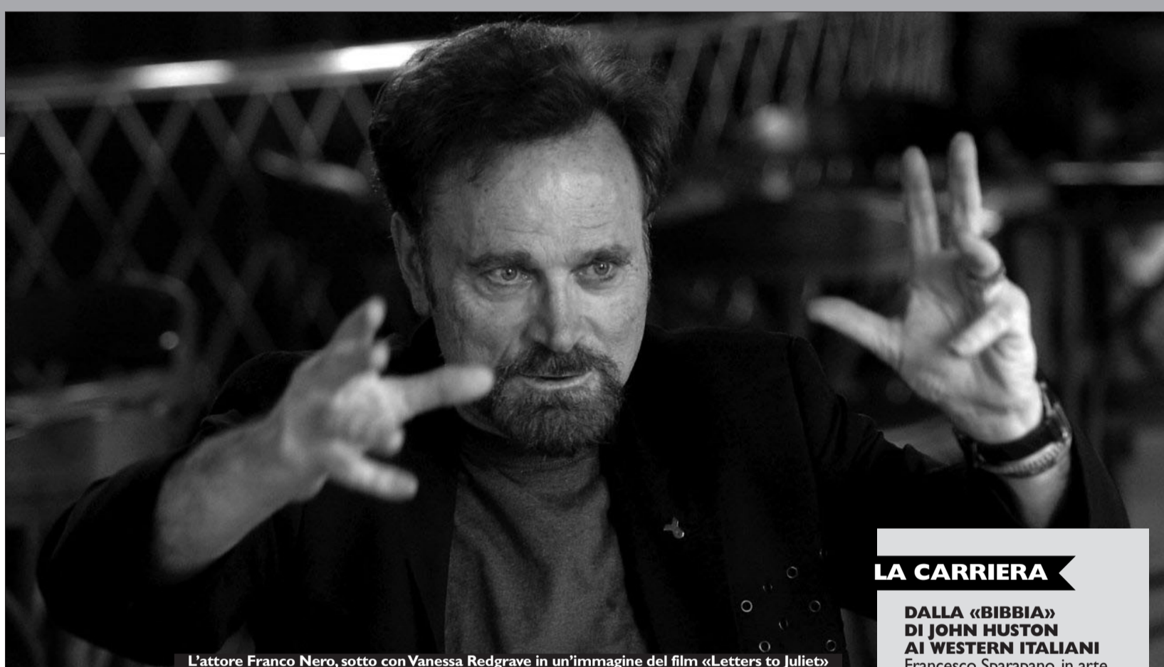
L'attore Franco Nero, sotto con Vanessa Redgrave in un'immagine del film «Letters to Juliet»