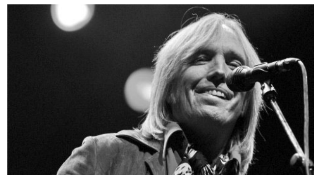
Tom Petty in tour negli States con gli Heartbreakers

ni ascolto solo musica neoromantica, ma credo che il battito sia quello del rock. Forse il modo in cui l'abbiamo concepito e registrato, tutto d'istinto con pochissime mediazioni della tecnologia, può avvicinarsi al senso delle incisioni blues. Per noi questo cd è una porta spalancata sul futuro». Come dice la biografia su Wikipedia, Petty non aveva alcuna aspirazione musicale finché Elvis Presley non visitò Gainesville, in Florida, la sua città natale. Fu mio zio a presentarmelo ricorda. «Non avevamo una vera e propria conversazione, visto che stringendomi la mano proferei poco più di un grugnito. Ma quell'incontro mi ha cambiato la vita; Elvis era circondato dall'allure della fama e la gen-