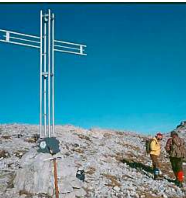
La croce sulla cima nei pressi dell'ex Rifugio Militare del Cogolo Alto

Gli alpinisti che fin dai primi decenni del secolo passato muovevano alla esplorazione e alla scoperta delle Piccole Dolomiti e del Pasubio, non potevano esimersi dal subire il fascino di una così maestosa parete. Certo non si arriva ai piedi dell'Incudine senza bagnarsi la schiena di sudore, occorre salire pendii selvaggi lottare coi baranci e le erbe viscide, tra fiori e stelle alpine e poi, le rocce stratificate ed il fragile calcare del Triassico, non potevano promettere quella solidità che invece hanno altre pareti delle Dolomiti maggiori. Pure, affrontando qualche maggior rischio, si poteva tracciare su queste lavagne il proprio disegno, la via nuova che come opera d'arte, (lo spiegava Emilio Comici) rechi in calce la firma indelebile dell'autore. Come quelle di Andrea Colbertaldo, Gastone Gleria, Renato Milani, Giovanni Rigotti e, più vicini a noi l'indimenticato Renato Casarotto con Diego Campi. I due pilastri dell'Incudine sono due bei capolavori del grande alpinista vicentino il cui corpo giace ancora ai piedi del K2 sepolto nei ghiacci himalajani.